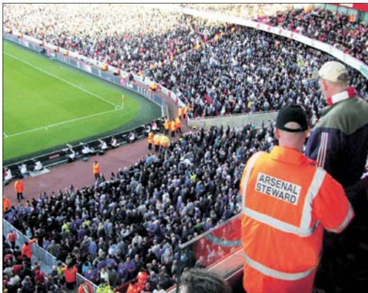
Evertonin fanikatsomo viime lokakuuisessa Arsenal-Everton-pelissä.

Valioliigassa kausi on tätä kirjoittaessani (8.5.09) viimeistä silausta vaille valmis. Vahvasti näyttää siltä, että ManU marsii vakuuttavasti mestaruuteen ja Liverpool & Chelsea taistelevat toisesta ja kolmannesta sijasta. Nelosena majailevalla Ar-